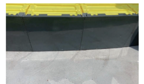
(※) 間口幅 1,000mm 平滑下地での試験値であり保証値ではありません。