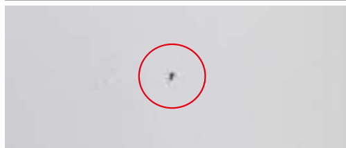
目視にて表面の傷を確認！